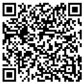
新生基本資料表單