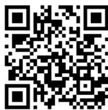
新生基本資料表單