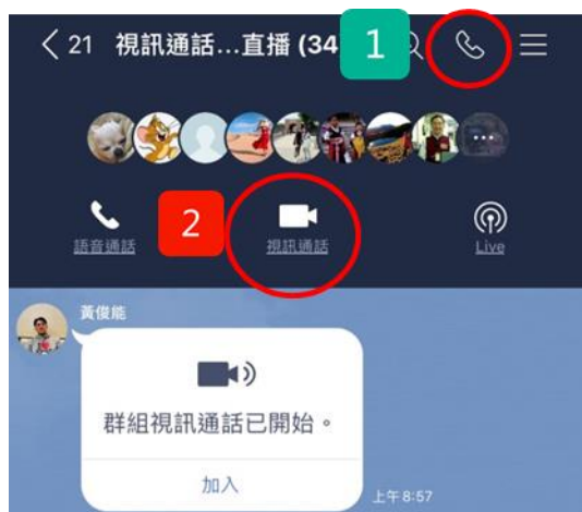
圖 2: 啟用視訊通話功能

一、依序點選畫面右上方的「電話」圖示；「視訊通話」功能，詳如圖 2，即可開始使用視訊通話。