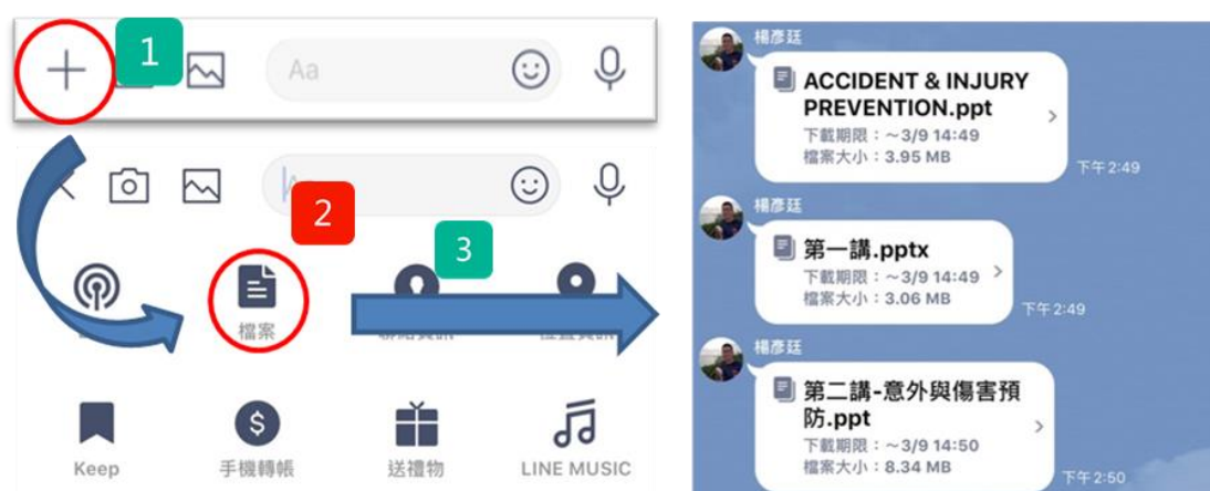
圖 3: Line 的檔案傳送功能