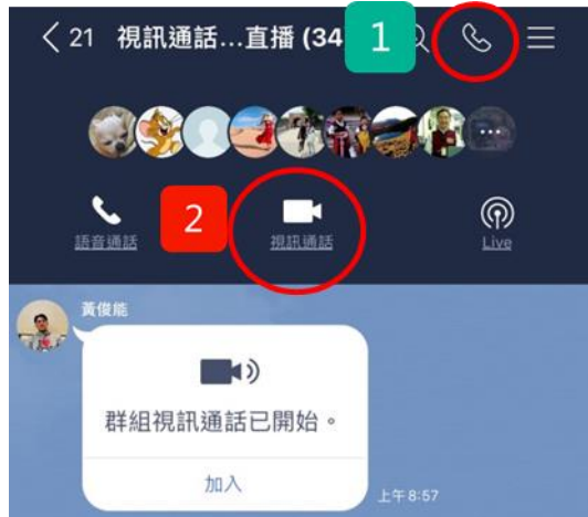
圖 2: 啟用視訊通話功能

一、依序點選畫面右上方的「電話」圖示；「視訊通話」功能，詳如圖 2，即可開始使用視訊通話。