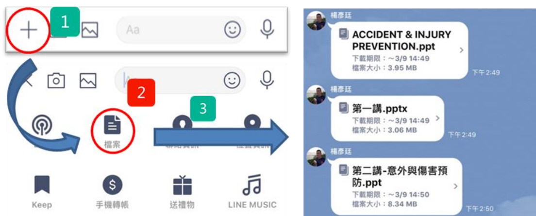
圖 3: Line 的檔案傳送功能